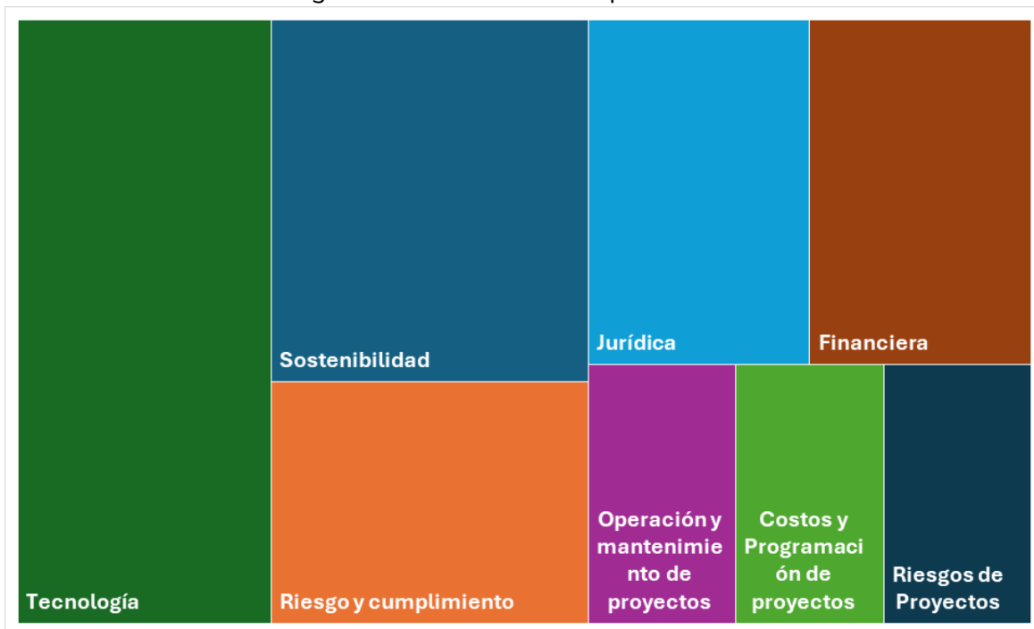
Imagen 1. Prioridad de áreas por automatizar

En la aplicación del procedimiento de Gestión de Innovación, se detectaron 28 procedimientos de Proindesa, susceptibles de automatizar en las áreas dando prioridad por volumen: